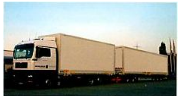
Un 'Gigaliner' de 60 tonnes