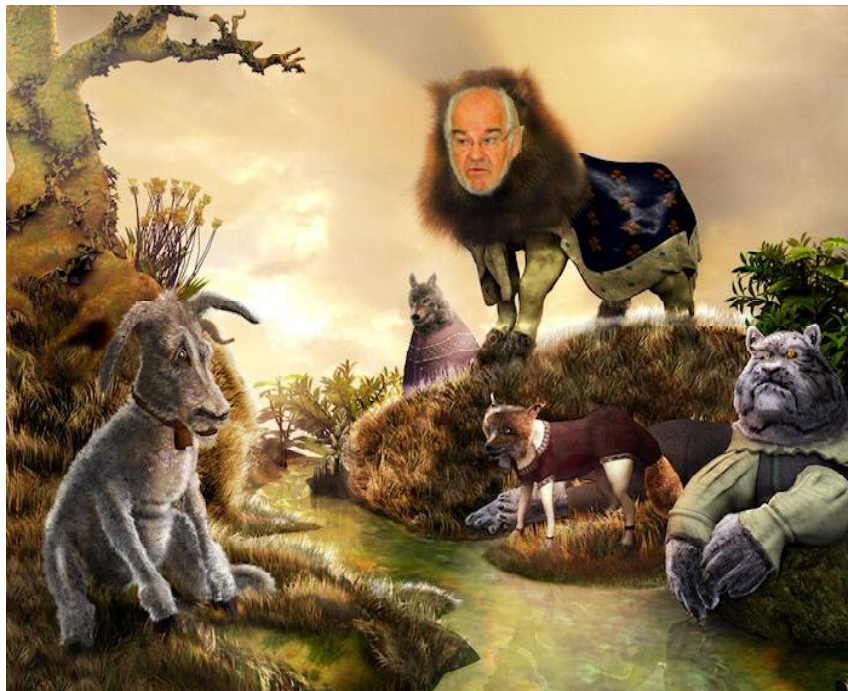
Scène de chaleureuse concertation autour du franchissement de la Loire. A droite, le Président et ses sbires. A gauche : nous...

Dans une phase de "concertation" imposée par le Préfet en 1999, ED avait proclamé que les décisions sur le tracé ne seraient prises qu'avec l'accord d'une majorité de communes concernées.. Les maires avaient alors élaboré une solution consensuelle, un tracé alternatif entre Saint-Denis et Châteauneuf. Il satisfaisait cette ville où le franchissement est ancien et mal adapté. Mais cette proposition ne fut jamais prise en compte dans les comparatifs de la Direction des routes.